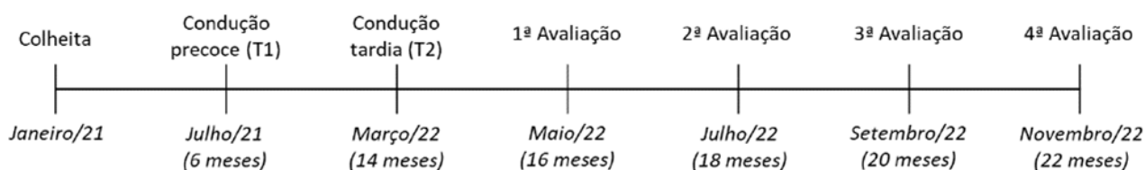
Figura 1 – Linha do tempo das atividades de condução (precoce e tardia) e das avaliações realizadas nas brotações de eucalipto a partir da colheita do ciclo anterior.

O momento de realização das atividades de condução e as avaliações realizadas durante o projeto podem ser mais bem entendidos e visualizados na linha do tempo a seguir (Figura 1).