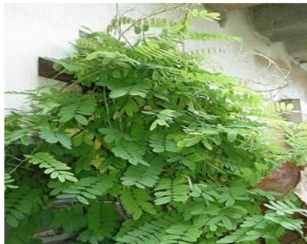
Planta Abrus pulchellus tenuiflorus .

No caso deste trabalho, este complexo é composto por um anticorpo que reconhece as células infectadas pelo vírus HIV e pela toxina pulchellina, proteína extraída de uma trepadeira nativa do Nordeste, a Abrus pulchellus tenuiflorus .