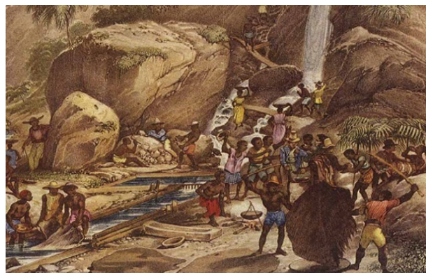
Ilustração do ciclo do ouro no Brasil colonial.

Sabará e várias cidades de Minas Gerais ajudaram na guerra de independência do Brasil e mantiveram a enorme colônia, como um país soberano. Um império que viria a ser admirado pelo mundo todo.