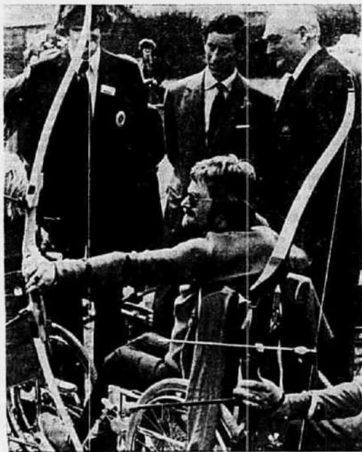
O príncipe Charles observa a competição de arqueiros paralíticos no sul da Inglaterra.

O início da produção do alto forno da Açominas será em 1980, mas a sação da sua coqueira será no último trimestre de 1979, como prevê o cronograma da empresa.